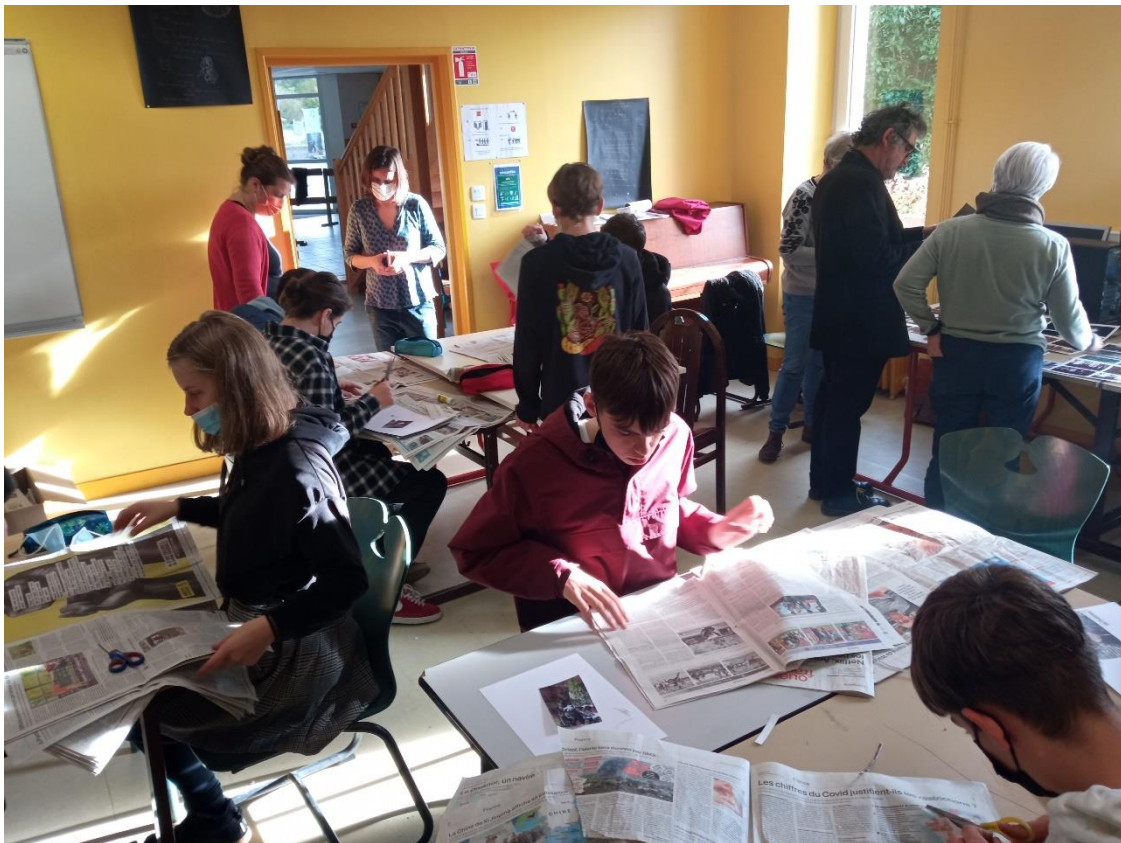
Une séance de travail avec des journaux.

Ensuite, après avoir sélectionné et imprimé un corpus d'images, les jeunes ont été invités à mettre en relation l'histoire du maquis de Coatmallouen avec leur histoire et leur ressenti du monde actuel, en répondant à la question : « Reste-t-il des empreintes du maquis dans le bois ? » et en s'inspirant du travail de Daniel Blaufuks.