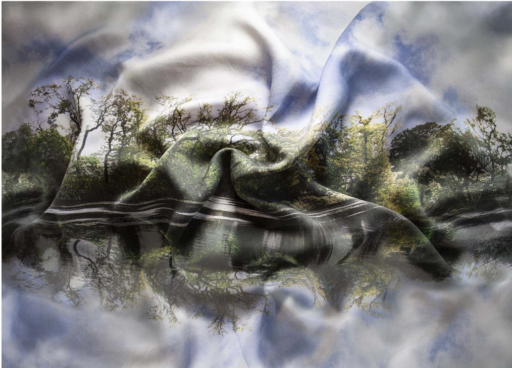
Paysage au reflets qui dansent , série Paysages 30x40cm, Impression sur papier semigloss, 7 Editions, 2020